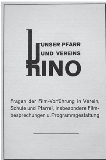
Abb. 4: Titelseite der Zeitschrift Unser Pfarr- und Vereinskino (erste Ausgabe vom Christkönigsfest (damals im Oktober) 1938).

Um der Forderung des Papstes nach einer katholischen Filmpressarbeit nachzukommen, wurde in Unser Pfarr- und Vereinskino auch damit begonnen, sogenannte «Zensurnoten» und Besprechungen aktueller Kinofilme zu publizieren. Diese reichten von «einwandfreie Filme» (Zensurnoten 1 bis 3b) über «schädliche Filme» (4 bis 4b) zu «schlechte Filme» (5 bis 6). 81 Besprechungen