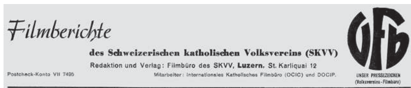
Abb. 5: Kopfleiste der Filmberichte des SKVV (1939, Nr. 1).

Im Gegensatz zu den USA blieben diese weitreichenden Ambitionen von Schweizer Katholiken vor allem Programm. Aus heutiger Sicht kann die Bedeutung solcher Forderungen jedoch darin gesehen werden, die Akzeptanz des Films unter der Bevölkerung vergrössert zu haben. In dieser Hinsicht war auch eine weitere Veröffentlichung des Filmbüros wichtig: Die ab September 1938 vierzehntäglich erscheinenden Filmberichte des Schweizerischen katholischen Volksvereins (Abb. 5). Diese beinhalteten keine Filmbesprechungen, sondern allerlei Nachrichten aus der Welt des Films: Ankündigungen von bald erscheinenden Filmen, Berichte von Filmwettbewerben, geschichtliche Hintergründe zu Produktionsländern, Informationen über neue Gesetze, die Filme betreffen, und Neuigkeiten über das katholische Filmschaffen im In- und Ausland. Die Filmberichte richteten sich nicht an die Betreiber von Vereinskinos, sondern an die Redaktoren von katholischen Zeitungen und Zeitschriften. Diese konnten den Berichten nach Belieben einzelne Artikel entnehmen und sie in ihrer eigenen Publikation nachdrucken. Die Filmberichte wurden in Zusammenarbeit mit der