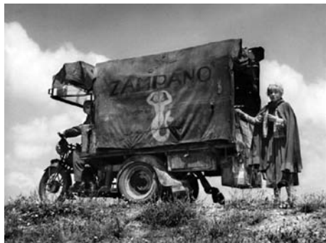
Илл. 2. Кадр из фильма Феллини “Дорога”.

в сфере его границ. Так, в поисках партнера для своих выступлений он покупает у крестьянки дочь Джельсомину, включая ее в цирковую программу и, сверх того, в ритм всей своей бродячей жизни. По сути, здесь представлен символический акт захвата земледельца в номадический плен: девушка из крестьянской семьи отныне принадлежит циркачу-номаду. Цирковая жизнь на колесах, показанная в фильме, ощущается не как перемещение, направленное из одной точки в другую, а как бесконечное движение по миру, лишенное конечного пункта назначения, пронизанное случайностями. Гладкое пространство бескрайних ландшафтов изоморфно в фильме безграничным степям номадического мира. Как и номады, Джампано черпает в степи витальные силы, он оставляет в ней свои следы,