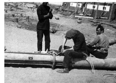
Илл. 1. Александр Родченко. Собирают конструкции цирка Шапито).

товая ткань цирка, ее проницаемость и уязвимость перед природными катаклизмами, передают присущее артистам ощущение хрупкости, бренности всех материальных ценностей, порождаемых цивилизацией. Подобное чувство возникает также и при взгляде на юрту, ярангу, типи или шатер бедуина. Кольшки, которые вбиваются в землю, для того чтобы установить цирковой шатер, а также стойки-мачты, на которые натягивается брезентовый полог, являются знаками-метками присвоения и обживания чужой территории (см. илл. 1). И даже когда цирк уже разобран, от него остается метафизический след, хранящий память о проходивших на этом месте представлениях. В фильме Чарли Чаплина