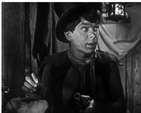
Илл. 5. Кадр из фильма Алексея Баталова “Три толстяка”.

Этот факт хорошо обыгрывается в романе Юрия Олеши “Три толстяка”: только благодаря цирковому гимнасту Тиббу и его юной ассистентке Суок становится возможной победа над господством триоправительства. В экранизации романа Алексеем Баталовым гимнаст Тибул уже в начале фильма вооружен обручем, увешанным огнестрельным оружием. Позже он показан уже с оружием в руках.