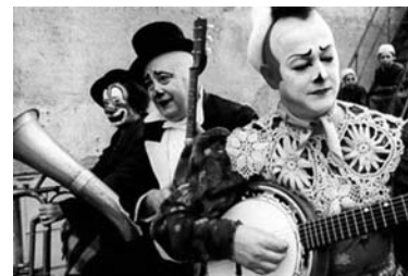
Илл. 6. Кадр из фильма Феллини “Клоуны”.

Гуляя по рядам, увидите вдруг чрезвычайное волнение в народе, услышите топот лошадей, пронзительный бой барабанов, и явится глазам вашим взвод амазонок, как можно раздуряемых, как можно распещренных; вместо стрел и копий летят из рук их во все стороны афиши, которые говорят: в семь часов вечера будут пантомимы, игры гимнастические и балансеры. 8