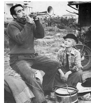
Илл. 3. Кадр из фильма Феллини “Дорога”.

пано, а вместе с ним и цирковую жизнь, девушка в конце концов умирает. В одной из сцен Джампано играет на трубе, напоминая один из иконографических образов возвещающего о Страшном суде архангела Михаила. Михаил был змееборцем – змея изображена на левой руке Джампано. На правой его руке – татуировка со скрещенными шпагами, своего рода аллюзия на копье архангела Михаила. Образ клоуна