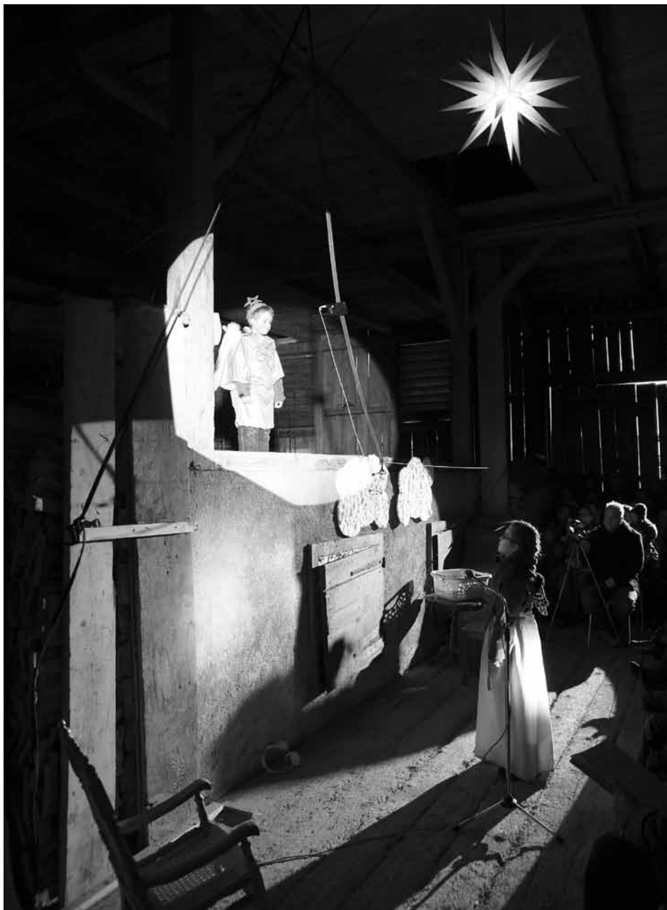
Lebendige Kirchgemeinde: Krippenspiel im Stall in Untervaz GR 2011.