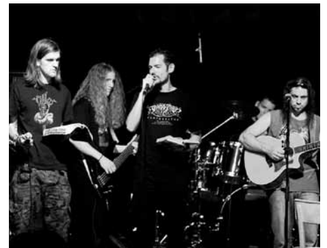
Metal-Festival: Elements of Rock