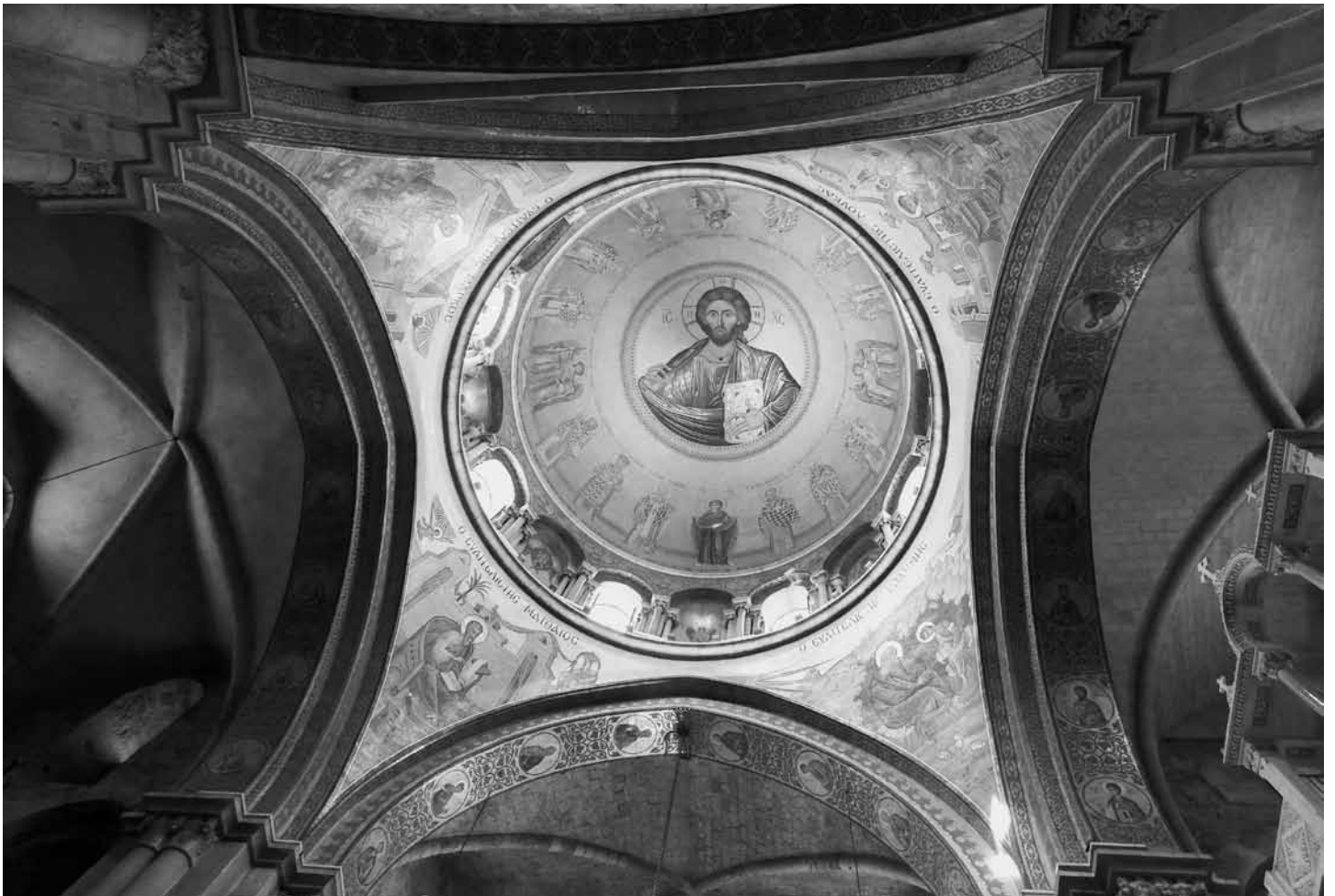
Jesus Christus, der Herr der Kirche. Pantokrator (griech. Allherrscher) in der Kuppel der Jerusalemer Grabeskirche.

Man kann den Einschluss und Ausschluss von Menschen(gruppen) distanziert beschreiben. Jede Gesellschaft hat ihre Inklusions- und Exklusionsmechanismen. Versteht man Inklusion hingegen normativ als kontrafaktisches Handeln gegen das Gefälle quasi «normaler» Ausgrenzungspraxis, wird das religiöse – oder besser: evangelische Profil erkennbar. Was geschieht, wenn ein Mensch diejenigen segnet, die ihn verfluchen? Oder was geschieht in einer Gemeinschaft von Unterdrückten, wenn einer, der mit der Besatzungsmacht kollaboriert, nicht verdammt wird? Wenn also Umkehr, Vergebung und Versöhnung als Handlungsoptionen ins Spiel kommen? Wenn einem Menschen der Himmel versprochen wird, den alle zur Hölle wünschen? Wenn einer Frau, die eigentlich aus der Gemeinschaft ausgeschlossen werden müsste, weil sie untreu war, nicht die Leviten gelesen werden, sondern in Anwendung von Leviticus