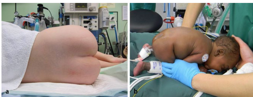
Abb. 2 ▲ Lagerung des Patienten zur Anlage des Kaudalblocks. a Seitenlage beim anästhesierten Kind, b Froschstellung beim wachen Säugling