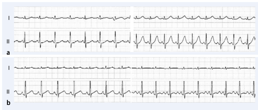
Abb. 4 ▲ Vier EKG-Ableitungen I und II vor (links) und nach (rechts) i.v.-Injektion einer Testdosis von 0,125%igem Bupivacain mit Adrenalin 1:200.000. a Ein 5,3-jähriges Mädchen, b ein 15-jähriges Mädchen

he T-Wellen sind Zeichen der zunehmenden kardialen Toxizität und können dem Herz-Kreislauf-Kollaps vorausgehen [17, 24].