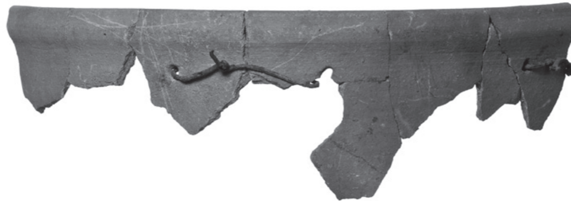
Abb. 4: Zylinderförmiges Kühlgefäss mit Flachwulstrand aus dem Bereich der Produktionshalle der Glashütte von Court. Zu beachten sind die teilweise aschegraue Oberfläche und die Flickungen aus Eisendraht.