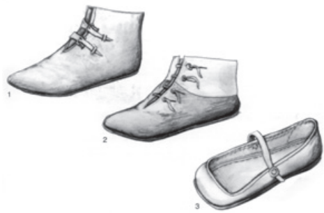
Abb. 2: Auswahl der in der Zuger Werkstatt hergestellten Schuhmodelle. 1 «Braunschweig», 2 «Den Bosch» (1490–1510), 3 «Kuhmaulschuh» (1. Viertel 16. Jahrhundert).