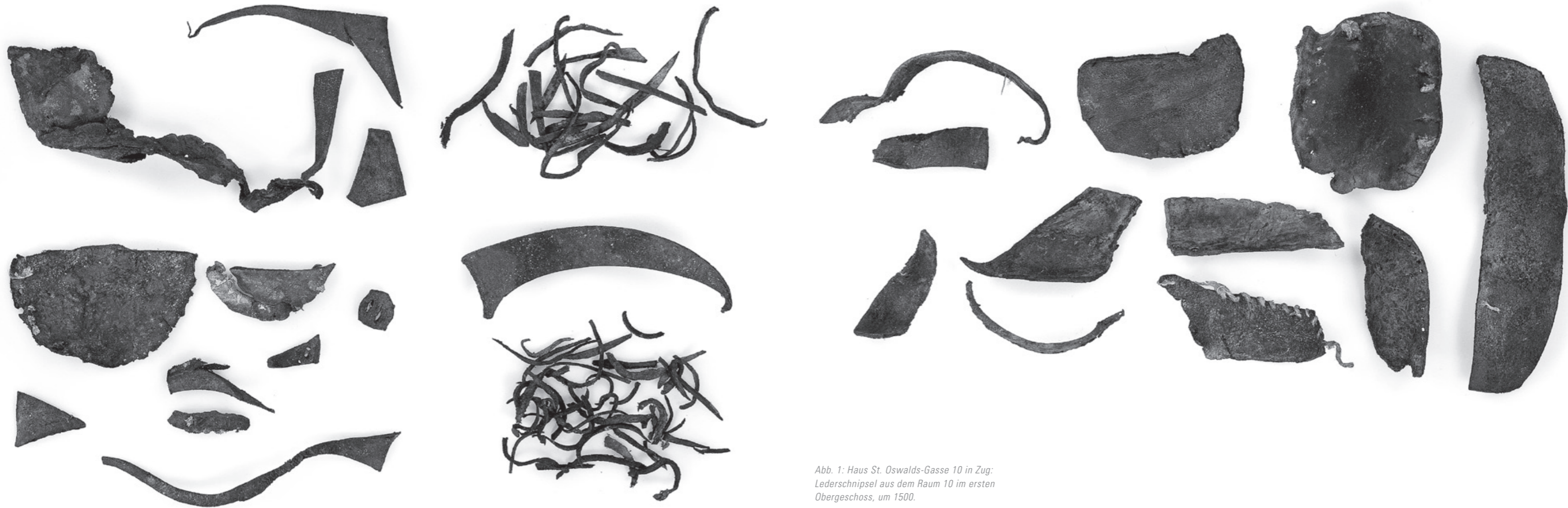
Abb. 1: Haus St. Oswalds-Gasse 10 in Zug: Lederschnipsel aus dem Raum 10 im ersten Obergeschoss, um 1500.