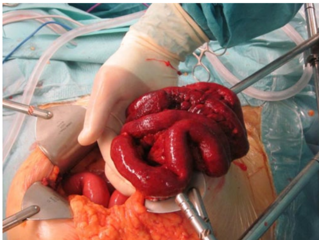
Abb. 1 ◀ Akute Mesenterialischämie des distalen Jejunums 24 h nach Symptombeginn