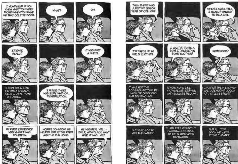
Illustration from Fun Home by Alison Bechdel. Copyright © by Alison Bechdel. Reprinted by permission of Houghton Mifflin Harcourt Publishing Company. All rights reserved.

Eindrücklich geschieht dies etwa in einer Anhäufung kleiner und beinahe gleich bleibender Panels, mit der die Comic-Zeichnerin bei einem zentralen Gespräch zwischen Vater und Tochter kunstvoll eine Atmosphäre von Anspannung und Verlegenheit kreiert, indem das zögerliche Gesprächstempo durch Schweigepausen in Zwischenpanels illustriert wird. 18 In dieser Szene hat Bruce erst kürzlich von der Homosexualität seiner Tochter erfahren und outet sich ihr gegenüber ebenfalls. Bechdel verwendet den zeichnerischen Raum hier bewusst dazu, bestimmte Stimmungen innerhalb einer Handlungssequenz herzustellen: Die aneinandergereihten kleinen Panels zeigen Vater und Tochter auf einer Doppelseite mit fast gleich bleibender Position und Mimik. Einige Panels beinhalten Dialog in Sprechblasen, einige nur die Gesichter ohne Sprech- oder Gedankenblasen (Schweigepausen). Andere wiederum sind durch Bechdel aus der Retrospektive kommentiert. Die fast spürbare Unbehaglichkeit in dieser Szene wird also vor allem zeichnerisch-räumlich erreicht. Zugleich stellt diese Szene den aufrichtigsten Moment zwischen Alison und ihrem Vater dar, der durch die Vergabe einer Doppelseite zusätzlich an narrativem Gewicht gewinnt. Alisons Eingeständnis,