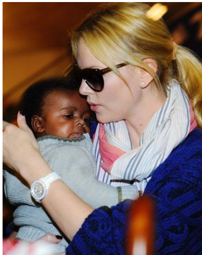
Abb. 2: Charlize Theron mit ihrem Adoptivkind.

halt etc. nicht alleine machen muss, dann kann man sich auch mal 5 bis 15 anschaffen.“ 89 Zentral für eine positivere Bewertung einer Promi-Adoption ist hier vor allem die Glaubwürdigkeit der tatsächlich elterlichen Beschäftigung mit dem adoptierten Kind, also die Authentizität der präsentierten Mutter- (seltener Vater-) Rolle des adoptierenden Elternteils.