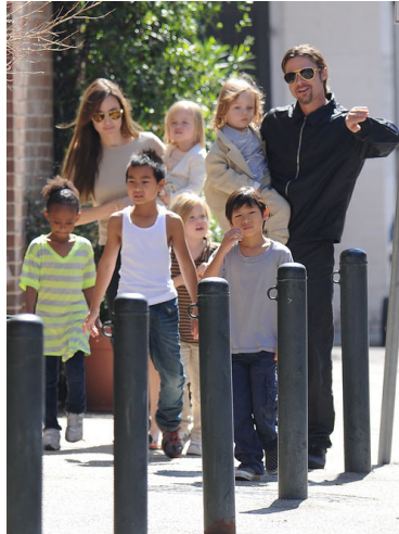
Abb. 1: Angelina Jolie und Brad Pitt mit ihren Adoptivkindern.

donnas Repräsentation wird dadurch mit Selbstsucht statt Rettertum konnotiert und ihre finanziellen Ausgaben mit dem Kauf eines begehrten Objekts statt der grosszügigen Spende einer bessergestellten Person aus dem Westen verglichen.