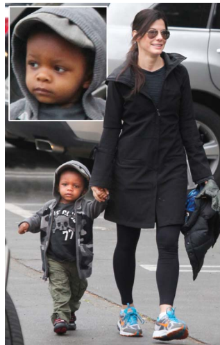
Abb. 3: Sandra Bullock mit ihrem Adoptivkind.