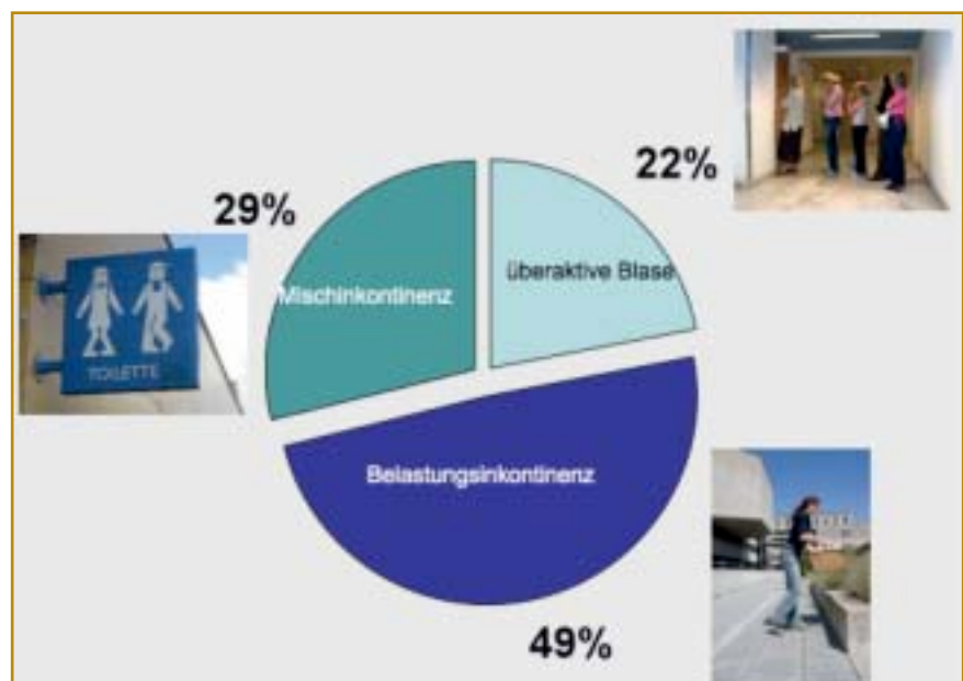
Abbildung 1: Verteilung der häufigsten Inkontinenzformen (nach Hunskaar 2003)

Die inkontinenzspezifische Anamnese umfasst das gezielte Erfragen nach Alltagssituationen, in welchen Urin abgeht ( Tabelle 1 ), nach der Notwendigkeit, Vorlagen zu tragen, nach Senkungsgefühl, rezidivierenden Harnwegsinfekten (HWI),