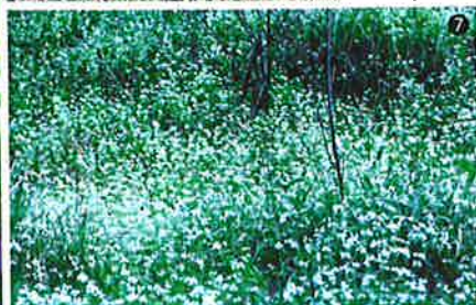
④シロイヌナズナ(左)とナズナ(右)。シロイヌナズナが長い果実をもつのにに対し、ナズナはパチ型の果実をもつ。京都大学構内にて。 ⑤ハナナ。鴨川(京都)にて。 ⑥ミヤマハタザオの低地型であるタチスズシロソウ。琵琶湖岸の墓地の砂上にひっそりと生きている。 ⑦ハクサンハタザオの一面の草原。ミヤマハタザオと同様に、シロイヌナズナとの雑種ができる。大阪府多田銀山跡にて。