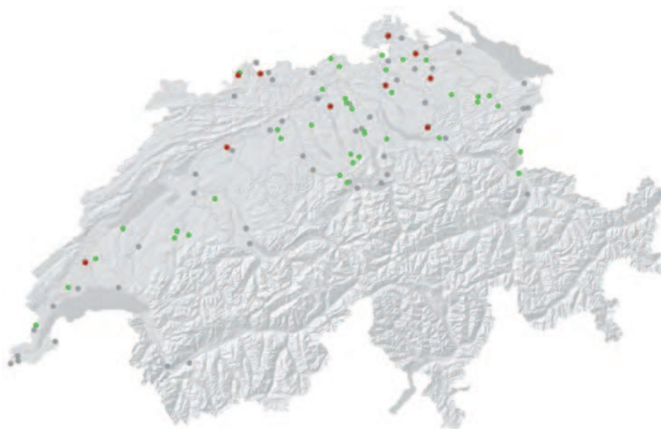
Die Karte zeigt das Resultat der Feldarbeit für die Aktualisierung der Roten Liste von 2005 für die Gelbbauchunke ( Bombina variegata ). Grüne Punkte zeigen frühere Vorkommen, die bestätigt werden konnten, während graue Punkte Vorkommen zeigen, die nicht bestätigt wurden. Rote Punkte markieren neue Populationen.

Für alle weierbewohnenden Arten (ausser den häufigen Arten Grasfrosch, Erdkröte und Bergmolch) wurden je 25 Laichgebiete (d.h. Populationen) zufällig ausgewählt. Weil in jedem Laichgebiet oft mehrere Arten vorkamen, ergaben sich pro Art Stichprobengrößen von 25 bis 100 Laichgebieten. Insgesamt wurden 300 Amphibienlaichgebiete untersucht. Alle Laichgebiete wurden durch Spezialisten vier Mal besucht. Ziel war es, die (noch) vorkommenden Amphibienarten zu erfassen. Vier Besuche waren einerseits wegen der Phänologie der Arten notwendig, andererseits dienten die mehrfachen Besuche auch dazu, Nachweiswahrscheinlichkeiten der Arten abzuschätzen. Mit Hilfe der Schätzwerte der Nachweiswahrscheinlichkeit konnte ermittelt werden, wie viele Populationen übersehen wurden. Es zeigte sich, dass dank der vier Besuche praktisch keine Population unentdeckt blieb. Zur Berechnung des Kriteriums «Abnahme des Bestandes» wurde der bei den Feld-