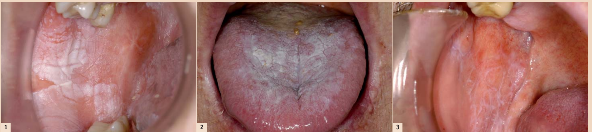
Abb. 1: Plaqueartige Form. – Abb. 2: Pflastersteinartige Veränderungen auf dem Zungenrücken. – Abb. 3: Retikuläre Form im Sinne der Wickhamschen Streifung.

Bei der plaqueartigen Form sind häufig pflastersteinartige Veränderungen auf dem Zungenrücken oder Planum buccale und seltener an den Zungenrändern zu finden. Diese pflastersteinartigen Modifikationen präsentieren sich meist flächenartig als fleckförmige Weißfärbung, differenzialdiagnostisch muss sicherlich auch der weiße Schleimhautnävus, Leukoplakie und Verätzungen der Mundschleimhaut in Betracht gezogen werden.