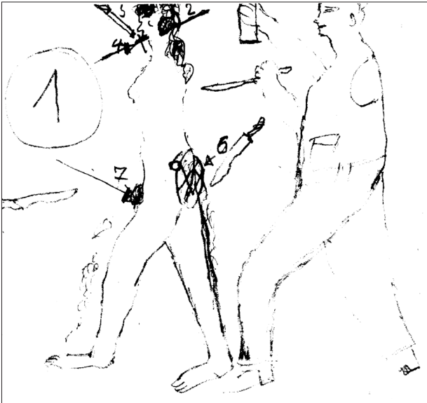
Abbildung 1: Oberer Teil des A4-Blatts