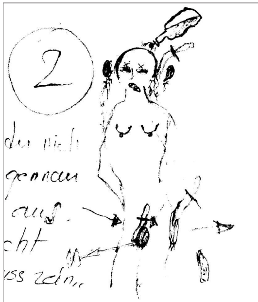
Abbildung 2: Unterer Teil des A4-Blatts