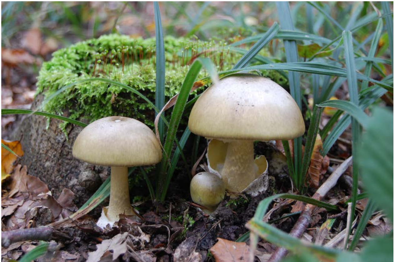
Abbildung 1 Amanita phalloides nach K. Schenk-Jäger, STIZ

Zu Vergiftungen kommt es meist durch Unkenntnis oder Verwechslung mit Speisepilzen. Zuerst treten häufig leichte Symptome auf, die mit einer unspezifischen Gastroenteritis verwechselt werden können(1). Aufgrund der hohen Toxizität und der damit verbundenen Letalität und Mortalität ist die sofortige Einleitung einer Therapie bei geringstem Verdacht auf eine Amatoxinvergiftung notwendig.