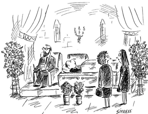
Abb. 1: He's still in therapy 24