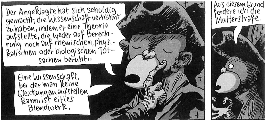
Abb. 2: Freud vor Gericht 35