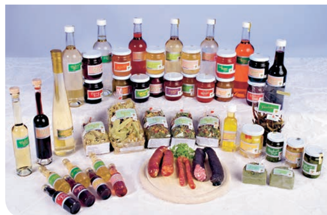
Touristische Wertschöpfung kann z.B. über lokale Labelprodukte generiert werden.

Mit der Gesamtheit aller Massnahmen in den Pärken soll nicht nur die regionale Wirtschaft gefördert, sondern auch landschaftliche, kulturelle und gesellschaftliche Werte gestärkt und erhalten werden. Diese sind kaum monetär bewertet und bleiben in Wertschöpfungsstudien unberücksichtigt, stellen aber ebenfalls ein wichtiges und zu berücksichtigendes Kapital für eine Region dar.